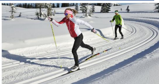
tek na smučeh