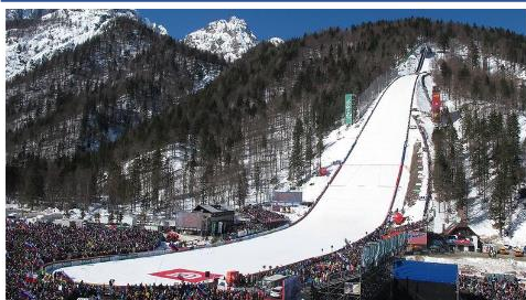
skakalnica v Planici

Tekmovalci bodo svoje sposobnosti kazali v treh disciplinah: smučarskih skokih, teku na smučeh in nordijski kombinaciji (tekmovalci tekmujejo v obeh disciplinah, v teku na smučeh in skokih). V desetih tekmovalnih dneh bomo na slovenskih tleh tako okronali nove svetovne prvake in prvakinja. (6. in 9.a razred)